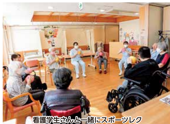
看護学生さんと一緒にスポーツレク