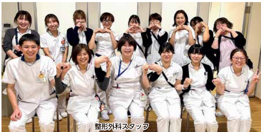
整形外科スタッフ

整形外科病棟では、骨折などの運動疾病や外傷等の治療をしています。突然の怪我や病気により自分では体が自由に動かせない方が