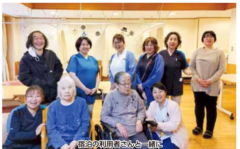
宿泊の利用者さんと一緒に