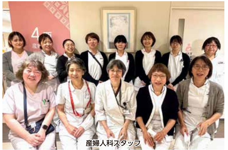
産婦人科スタッフ

産婦人科病棟では、婦人科治療や妊娠・分娩・産後の患者さんが入院しており、女性ならではの悩みや不安に対して、思いや訴えに耳を傾け寄り添う看護提供を心掛けています。「赤ちゃんにやさしい病院（BFH）」認定病院であり、助産師が皆様の一人一人のパートナーとなって「自然なお産」と「母乳育児」