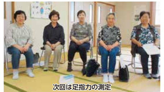
今回は足指力の測定