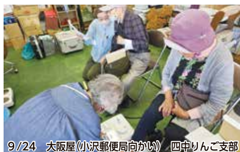
9/24 大阪屋(小沢郵便局向かい) 四中りんご支部

交流会のまとめで医福連常任理事の國井勝義さんが「活動発表をした8組の生協の人たちはとても素晴らしい。でも日々活動している私たちも、とてもすごいことをして