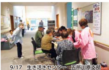
9/17 生き活きセンター 五所川原支部