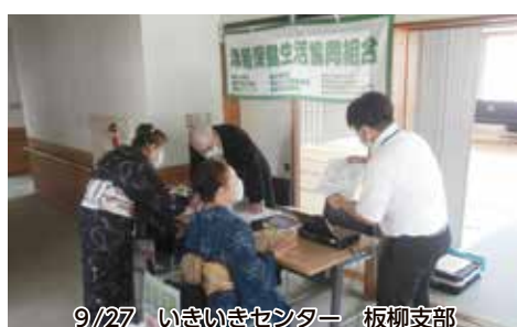
9/27 いきいきセンター 板柳支部