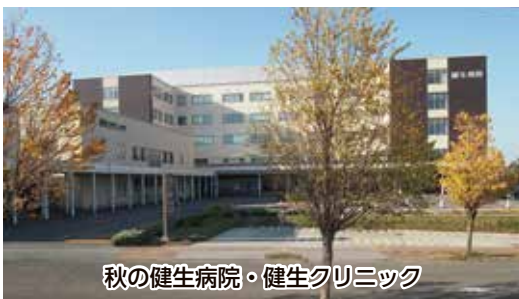
秋の健生病院・健生クリニック

大きく伸長したことが経営悪化の主要因です。残業削減や職員配置数の見直し、使用する材料の変更や使い方・在庫確保などの見直し、予定していた修繕の取り止めや水光熱費の節減など、短期的に取り組めることの実践や費用削減に対する職員の意識向上の積み重ねによって大きな削減効果が生まれています。今後も継続していくことに加え、時間をかけてでも改善が必要と判断される費用についても削減に向けて準備を進めています。また、事業収益が予算を下回る傾向が続いているため、運営資金維持のためには収益を確保することが最重要であることの意識を強化しながら、職員一同引き続き奮闘してまいります。