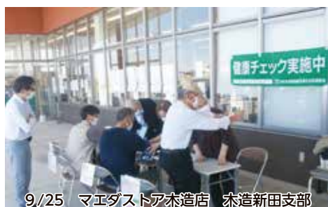
9/25 マエダストア本店 木造新田支部