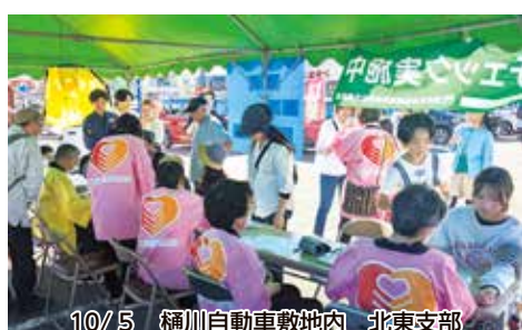
10/5 樋川自動車敷地内 北東支部