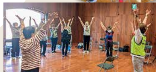
体操やストレッチで体力づくり