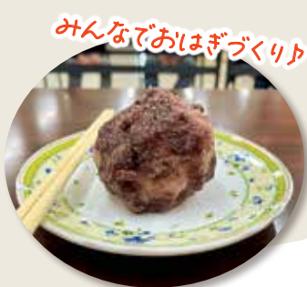
みんなでおいしきづくり