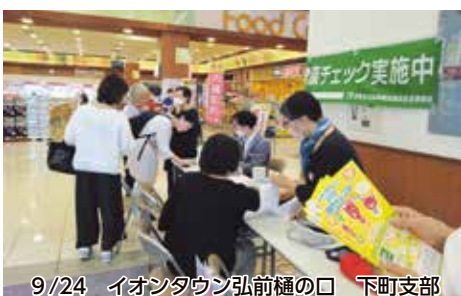
9/24 イオンタウン弘前樋の口 下町支部