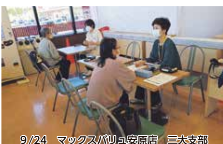
9/24 マックスバリュ安原店 三大支部