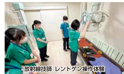
放射線技師 レントゲン操作体験

い立ちまでさかのぼり支援について考える検討会。最後に自分が学んだことの報告と「医療職の多職種連携」についてグループディスカッションを行いました。半日のプログラムでしたが、時間はあっという間だったと思います。参加者からは、「ネットで調べるだけでは分からないことを知れた」、「直接職場を体験する機会がない中、患者と直接触れ合ったり、機械を体験したりして、どのような職なのかを身をもって知れたし、将来の職業の選択にも貴重な機会だった」と好評な意見が多かったです。業務の合間に準備をしたり当日の対応に時間を