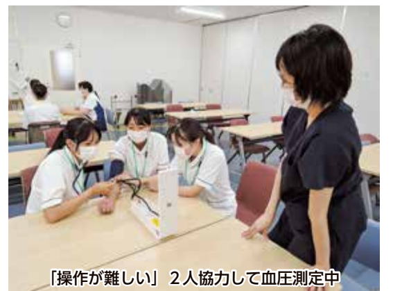
「操作が難しい」2人協力して血圧測定中

た。その後、看護師の指導の下で、バイタルサイン(「生命徴候」)のことで「脈拍」「呼吸」「体温」「血圧」「意識レベル」の5つが基本)の測定や車いす操作等の基本的な看護技術を体験しました。また栄養剤(食)の試飲を通して、患者の気持ちや栄養管理、食の大切さを学習しました。参加者から「病院の中は初めて見るものが多く、とても興味がわきました。また実際の患者を