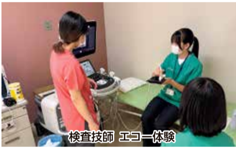
検査技師 エコー体験

医師や看護師、薬剤師の体験会はこれまでありましたが、それ以外の医療職の体験会はありませ