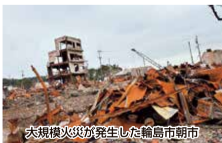
大規模火災が発生した輪島市朝市

本年元旦に石川県能登半島を震央とした大地震が発生し甚大な被害をもたらしました。健生病院・健生クリニックでは、1月〜3月の間本震災により被災された地域へ医療専門職による震災支援を実施しました。全日本民医連からの支援要請を受け合計7名が、それぞれの支援期間に現地を訪問し、支援活動を行いました。