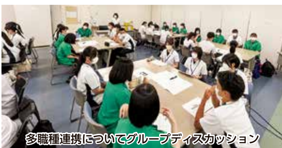
多職種連携についてグループディスカッション