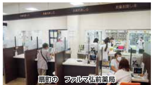
扇町の ファルマ弘前薬局

各支部の健康出前講座のメニューは、「こんなことが知りたい」という組合員さんのご要望に合わせて、具体化させていただきます。どうぞご相談ください。 (組織部)