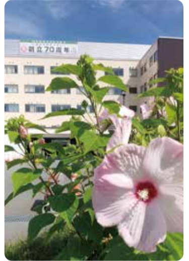
スイフヨウ(醉芙蓉) — 旧健生病院の玄関から2017年、新健生病院に移植。毎夏、美しく咲き続けてくれます。

1 「薬の飲み方」 薬の飲み方で守ることは、用法(1日何回、いつ飲むのか)、用量(1回にどれくらい飲むのか)です。食間とは、食後約2〜3時間のこと、食後は、食事が終わってから30分までの間、そして食前とは食事の30分前からのことです。 では、もしお薬を飲み忘れてしまった場合どのようにすればよいのでしょうか。その場合は、気づいた時にすぐ飲んでください。ただし、次に飲む時間が近い時は飲み忘れた分を飲まずに、次の時間に1回分だけ飲みましょう。2回分まとめて飲んでしまうと危険です。 また、薬が飲みにくい場合、錠剤を噛んだり、割ったりして飲んで中身だけ飲んだりしていませんか? 自己判断で薬の形を変えてしまうと、狙った効果が得られない、薬が強くなりすぎる、副作用が出やすくなります。 錠剤・カプセルを粉薬や水剤へ変えることも出来ますし、薬の量は変えずに小さい錠剤へ変えることも出来ます。 さて、皆さんお薬は何で飲まれていますか? 基本はお水で飲みましょう。冷たい水でも白湯でも構いません。水なしで薬を飲むと喉や食道に引っ掛かり炎症や潰瘍の原因になります(口腔内崩壊錠を除く)。水がない時は、お茶、ジュース、コーヒー、牛乳で薬を飲んで問題はありませんが、注意が必要なものもあります。 例えばコーヒーと喘息の薬、お茶と下痢止め、牛乳と抗生物質などです。詳しくは薬剤師へご相談ください。 漢方薬はお湯に溶かして飲むと良いでしょう。お湯に溶かすことでお茶のような感覚で飲みやすくなります。 また、オブラートや服薬ゼリーを使うと味やにおいが軽減され飲みやすくなります。ぜひお試しください。