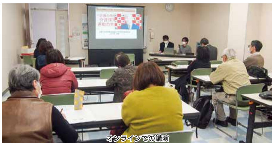
オンラインでの講演

3月12日、「良くする会」では学習会を催しました。リモートで講演したのは、大阪でケアマネジャーをし、「大阪社保協」介護保険対策委員長や「介護保険料に怒る会」事務局長の目下「介護危機を打開し、介護保障をめざす運動発展のために」でした。氏は、4つの要求案として、①現在の介護保険料の仕組みでは限界。国庫負担増で保険料引き下げをすること。②当面、市町村の一般財源を投入して保険料引き下げを行うこと。③保険料の余りを貯め込み(基金)して自治体は、全額保険料引き下げにまわすこと。④低所得者に対する介護保険料減免制度を拡充すること——以上を提言しました。