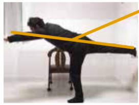
腕、背中、足を可能な限り直線に

手足を一直線に伸ばし、バランスを崩さないように気をつけながら、体を前傾させていく。