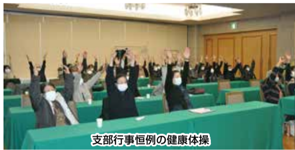
支部行事恒例の健康体操

2021年4月の支部総会でバスレクの提案をしたところ「楽しみにしています」という意見がありました。でも実のところ、本当にやれるのか半信半疑でした。ワクチン接種は進んだものの感染者数は減らず、計画を立てながらも本当にやるんだらうかという迷い、できたとしても感染者をだしたらどうしようというとても不安感がありました。