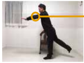
腕は伸ばしたまま

上体は直立の姿勢まで戻さず、足も下まで降ろさない程度に戻す。片側が終わったら反対側も行う。