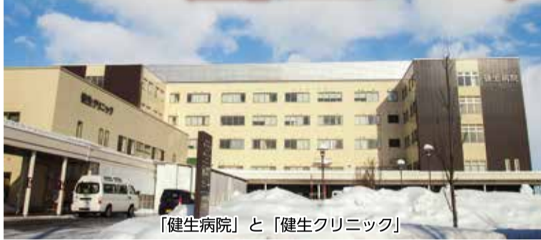
「健生病院」と「健生クリニック」

70年前の2月24日、津軽保健生活協同組合は創立されました。幾たびも経営危機におちいるなか、組合員・職員・医師のみなさんの力で乗り越えて、今があります。 班会や総会でみなさんのまわりにいる元職員や古くからの組合員の方々にお話を伺う機会をつくり、創立70年をお祝いしましょう。