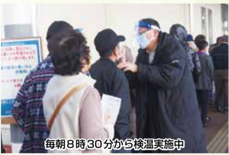
毎朝8時30分から検温実施中

10月12日から新型コロナウイルス受け入れを担う専任の看護チームを立ち上げました。10月19日から全体の診療を縮小して、院内にウイルスを持ち込ませない、院内でウイルスが拡大しない方策をとりました。