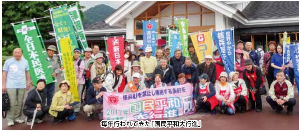
毎年行われてきた「国民平和民主大行進」

1945年8月、広島、長崎に原爆が投下されてから75年が経過しました。核兵器の開発、保有、使用を広く禁じる核兵器禁止条約は、批准の要件となる50の国と地域に達し、2021年1月22日に発効することになりました。「生きていくうちに核兵器のない世界を」と願う被爆者の想いに、寄り添い活動してきた私たちの運動が実を結