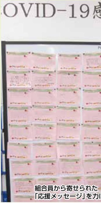
組合員から寄せられた「援メッセージ」を力

職員に対してはアンケートを実施したり、匿名で投稿できるシステムを設置したりして意見や思いを募りました。すべてを解決することは難しいですが、そのような場がストレスの放出先になったという一面もあります。