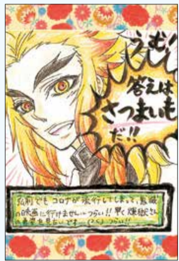
弘前市 くろのねこ