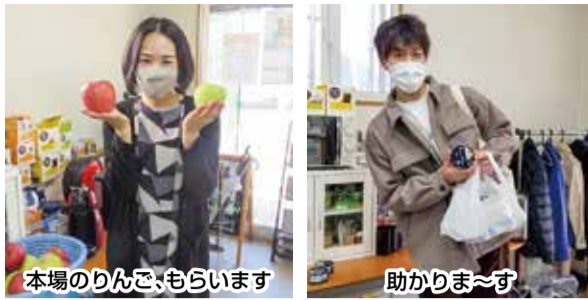
本場のりんご、もらいます

織部の力を借りて津軽保健生協の組合員にお話ししたところ、お米や野菜をはじめ本当にたくさん