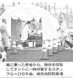
車に乗った患者から、検体採取してテントに一時保管するスタッフら＝21日午後、健生病院駐車場