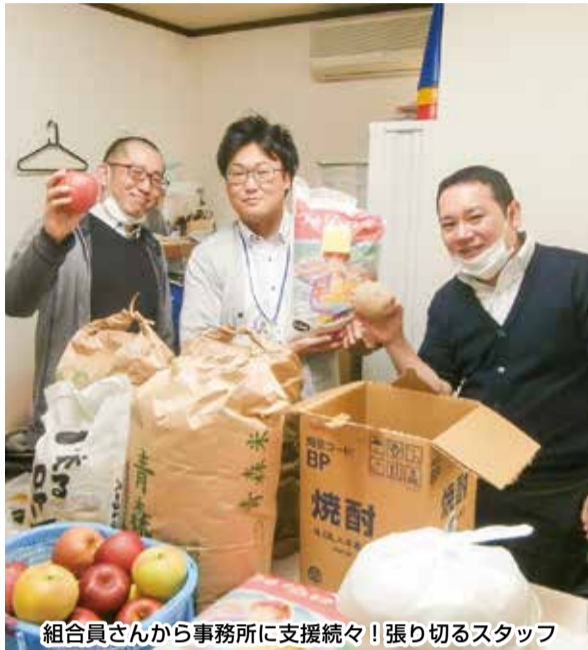
組合員さんから事務所に支援続々！張り切るスタッフ