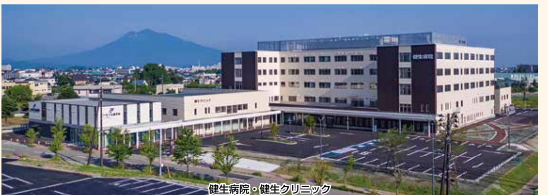
健生病院・健生クリニック

移転前と比較すれば(2016年と2019年の比較)、救急車の受け入れは約400件の増加、外来延べ受診者数は約1万件の増加、新入院数は約1000件増加しています。このことは、より多くの地域住民の「いのちと健康」を守っているという事実であり、医療関係者からの評価につながっています。