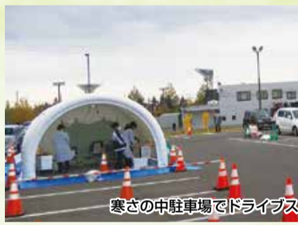
寒さの中駐車場でドライブスルーのPCR検査

弘前PCRセンターは、市医師会が予約を受け付けている。水曜日と金曜日の定期の検査に加え、弘前市の依頼を受け、17日と19日の検査も実施された。21日の検体採取は計120件に上った。