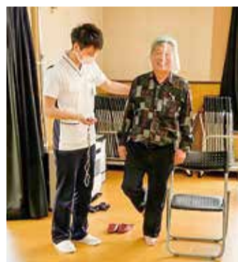
緊急事態宣言が解除され、7月15日、

思っております。5月から病棟配属がじまり、実際に現場に立ち、医療行為をしていく中で、患者さんや、上級医の先生方、同期から様々なことを学ばせてもらっています。成長することはいくらでもありますが、貪欲に学び、これからの業務に役立てていきたいと思えます。まだまだ未熟者ですが、皆様の健康に少しでも貢献できたいと思います。院内で見かけたときは一言声をかけて頂けるとありがたいです。今後とも宜しくお願いします。