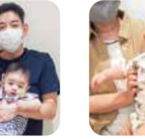
役立った「簡単な体操」