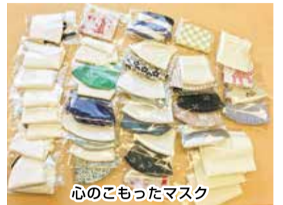
心のこもったマスク

して100枚を届けました。「かわいい、すてき」「選べるので嬉しい」と、受け取った入院患者さんからも感謝されました。 藤代健生病院のブログにもアップしています。