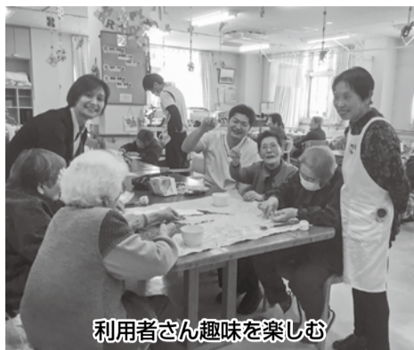
利用者さん趣味を楽しむ

津軽医院では外来の他、通所リハビリテーション及び訪問リハビリテーション、介護療養型老人保健施設(小規模老健)、居宅介護支援事業所を運営しております。浪岡地区において通所リハビリテーションを運営している事業所は2事業所のみとなっております。津軽医院通所リハビリテーションはそのうちのひとつです。高齢者の方々にリハビリを目的としたサービスを提供しています。利用者さんが可能な限り、自身の有する能力に応じ自立した日常生活を営むことができるよう、障害にあわせたりハビリテーションやレクリエーションなどの活動を通して、利用者さんの心身機能の維持回復を図り、生きがいある生活を送れるようお手伝いできるような努めています。