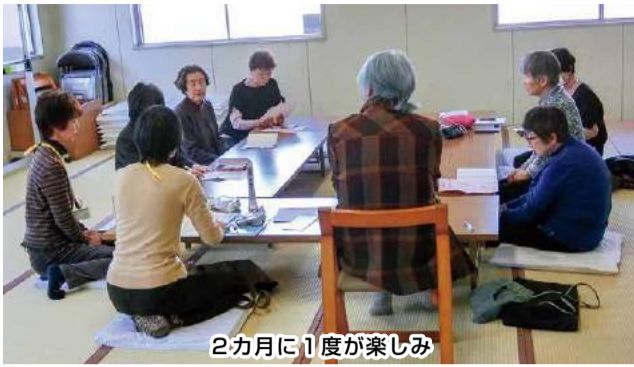
2カ月に1度が楽しみ

昨年5月下旬に三大支部の大富町に新しく班が結成されました。その名も「カッコー班!」名前を決める時に、花の名前以外でお願いしたところ、みんないろいろと話し合っている最中に、鳥のカッコウの鳴き声が聞こえたような…まるで班の結成を祝福しているようでした。そこで班員全員でカ