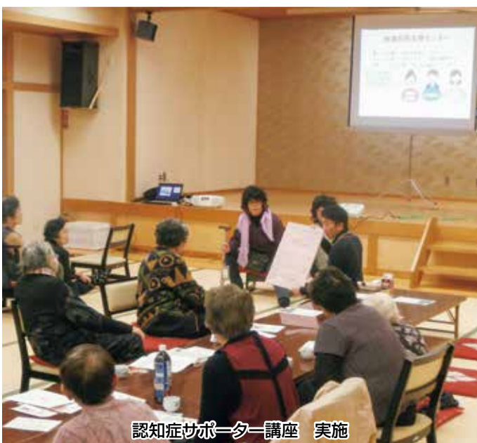
認知症サポーター講座 実施

当日は忙しいのにもかかわらず、西部包括支援センター全職員が来て下さり、非常に賑やかでした。活動者交流集会では、なかなか他地域の活動者との交流がないとのこと、司会者がマイクを回し、自己紹介や今困っていることなどを