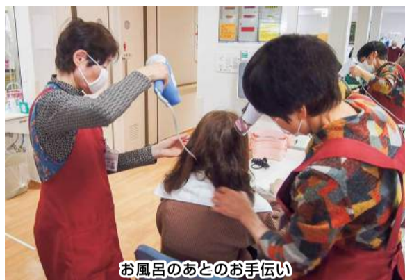
お風呂のあとのお手伝い

「通所リハビリテーション」が健生クリニックにあることを知っていますか。場所はクリニック入口とは分かれていて、反対側に入口があります。入院のあとリハビリの必要な方などが利用する施設です。