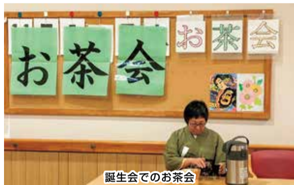
誕生会でのお茶会

そこで、病棟活動の支援をしていた退職者3名(アコーデオン演奏と歌声支援の元看護師、デイケア支援のケースワーカー、病棟でのお茶会には