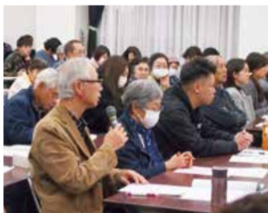
参加者からの質問もたくさんありました