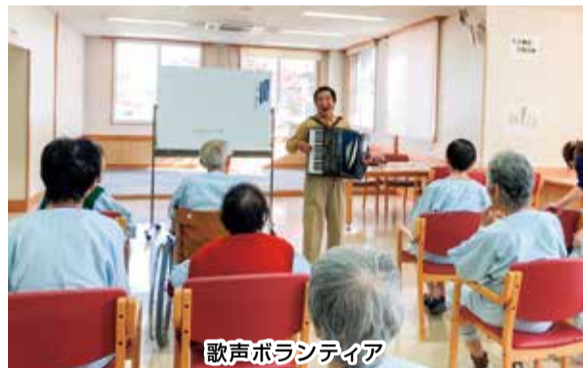
歌声ボランティア