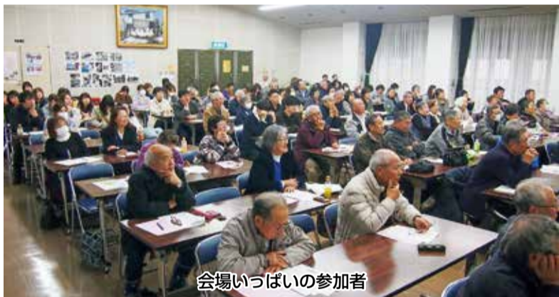
会場いっぱい参加者

今回発表は支部、ブロック、事業所の6人(上の写真)。ひとり15分の時間でじっくり説明し、質問にも一つひとつ丁寧に応える各発表者に拍手が起きました。