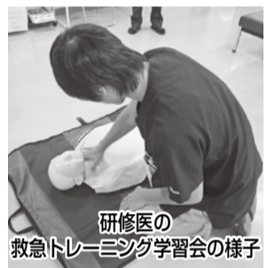
研修医の救急トレーニング学習会の様子

健生黒石診療所は今後も研修・実習施設として、職員全体で人材育成に取り組んでいきます。患者様・組合員の皆様、引き続きご理解、協力をよろしくお願い致します。