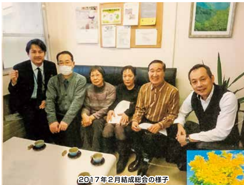
2017年2月結成総会の様子

この総会に院長・事務長・事務次長も参加し、静かに「よろしくお願いします」とごあいさつ。随分期待され、人も増やしてやって行こうと、まず抹茶仲間を誘いお茶会のボランティアを2名に。また、下町支部の会議時に花壇整備のボランティアを呼び掛けたところ5名が参加、草取り・花や種を持参して植え、花壇らしく整備されました。作業は迷惑のないよう早朝に行い、患者さんの「ずっと放置されていて残念だった」、「きれいにしてくれて、ありがとう」の声に励まされました。花壇がきれいになったら町会の方々から草取りをしてくれ、きれいの連鎖はつながっています。