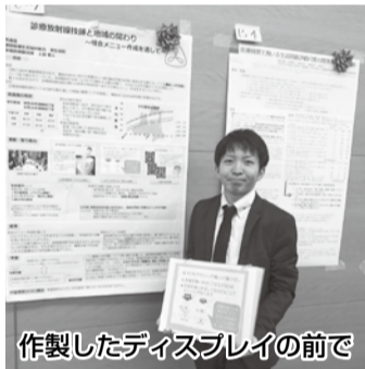
作製したディスプレイの前で

放射線科のHP活動の内容としては、当科が健康診断で担う3つの検査、胃X線検査（バリウム検査）・マンモグラフィ検査・頭部MRI検査について、組合員の方々にわかりやすく解説