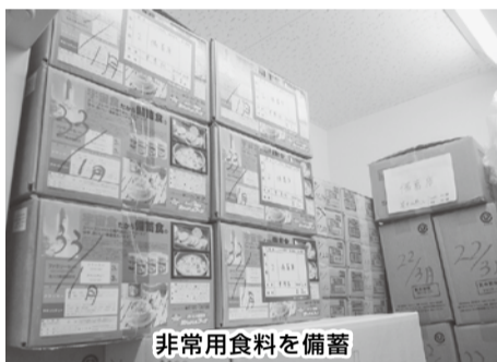
非常用食料を備蓄

災害時の対応策として備蓄品の確保が必要となります。また、停電時の対応では、病院全ての電力は賄えませんが最低