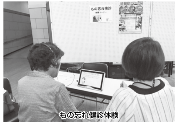
もの忘れ健診体験

当診療所は、五所川原市から市内で唯一「もの忘れ健診」の事業を委託されており、2018年度は134件の健診をしていました。 9月15日、五所川原市主催の「認知症フォーラム」がオルテンシアを会場に開催。五所川原市では、2016年に市長の「認知症の人をみんなで支え合うまちづくり宣言」とあわせて「認知症ケアパス」を作成し、市内の医療・介護事業所が一丸となって多種多様な取り組みをしています。 当診療所も最初から実行委員会に加わっていますので、積極的に各支部