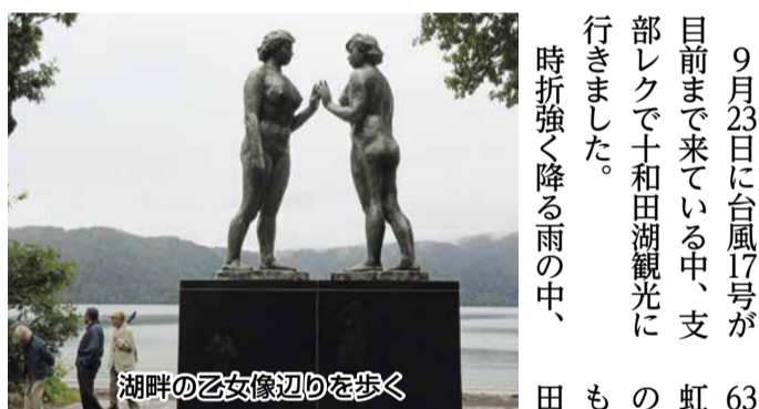
湖畔の乙女像回りを歩く

9月23日に台風17号が目前まで来ている中、支部レクで十和田湖観光に行きました。時折強く降る雨の中、63人がバス3台に分乗し虹の湖に集合。十和田湖の休屋では、幸いにも雨もやみ、乙女の像・十和田神社の散策を楽しみ、奥入瀬渓流をバスから見学。今年は晴れの日が多く十和田湖の水量も少なく、滝や溪流の流れも勢いがないようでした。 この日は観光客も少なくスムーズに通過、予定より早く焼山温泉・森のホテルに到着しました。こ