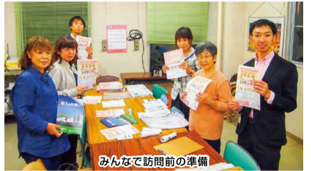
みんなで訪問前の準備