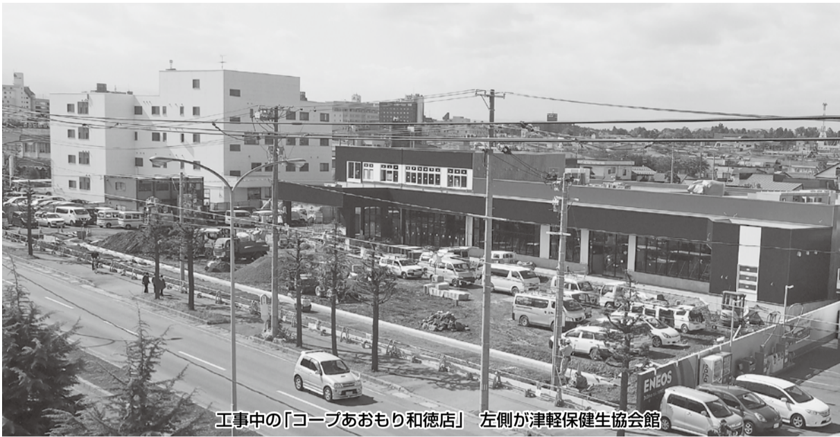
工事中の「コープあおもり和徳店」 左側が津軽保健生協会館

コープあおもり和徳店が11月15日からオープン予定です。現在、和徳店および津軽保健生協会の駐車場整備を進めています。