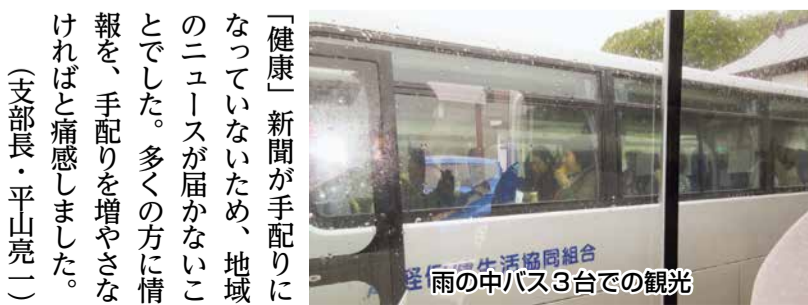
雨の中バス3台での観光

のあたりから雨脚が強くなり、予定していた奥入瀬渓流散策は中止。ホテルでの昼食、入浴でくつろぎました。 帰りに「長生きのお茶を飲んで」と「かやの茶屋」に寄ったところ、台風で店閉まり。これでは帰れないと酸ヶ湯温泉まで戻って、追加観光をしたバスもありました。 今までこんな楽しい企画を知らなかったと、初めて参加者された方も数名いました。友人の誘い、「健康」新聞を読んだ本部に問い合わせをした方。共通しているのは