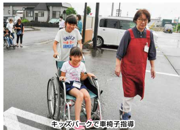
キッズパークで車椅子指導