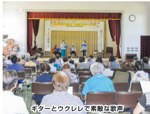
ギターとウクレレで素敵な歌声

による「フレイル体操」も行い、老化防止のヒントをもらいました。健康チェック、フリーマーケット、沖揚平の野菜、コーヒー、健康食品コーナーはどれも好評。また組合員の写真展、平和の写真展、趣味を越える見事な手芸作品は、見る人を楽しませていました。 午後は、駅前のダンススタジオSDCCのみなさん。組合員のウクレレとギター演奏と歌。続い