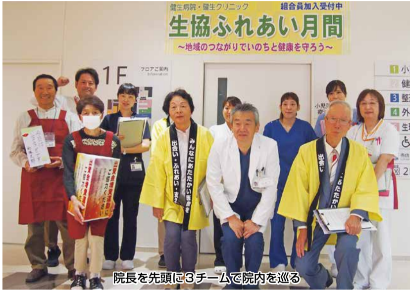
院長を先頭に3チームで院内を巡る

●日本国憲法より● 第13条 すべて国民は、個人として尊重される。生命、自由及び幸福追求に対する国民の権利については、公共の福祉に反しない限り、立法その他の国政の上で、最大の尊重を必要とする。 第25条 すべて国民は、健康で文化的な最低限度の生活を営む権利を有する。国は、すべての生活部面について、社会福祉、社会保障及び公衆衛生の向上及び増進に努めなければならない。