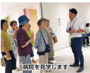
病院を見学します

このほど、美欧羅班8人で健生病院を見学しました。職員が2人も対応してくれて、普段見ることのできない管理室のようすも拝見しました。産婦人科の病棟付近では、赤ちゃんの泣き声も