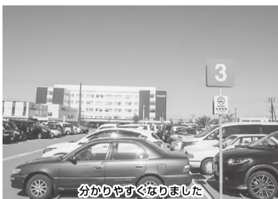
分かりやすくなりました

移動オープン以来、新病院の駐車場が広い為「どこに駐車したのか分からなくなった」とのご意見が多くありました。このたび目印としてコース・ポールを設置致しました。