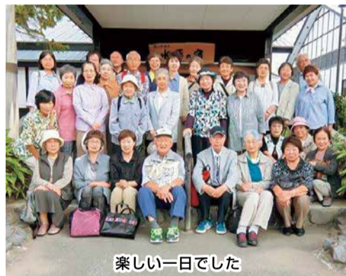
楽しい一日でした

合同班レクに、体操グループの方々も加わり、30人の参加者で楽しい交流の旅となりました。「瑞楽園」で大石武学流の庭園を堪能、ガイドの方からていねいな説明があり、雪踏みなどの昔の生活用具も拝見。弥生のアップルロードを通って、鱈ヶ沢「水軍の宿」に到着。早速お目当ての「ヒラメのづけ井」を味わいました。温泉とお話でゆつくりして、