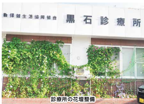
診療所の花壇整備

健生黒石診療所白鳥の会は、1998年9月にデイケアを開設することになり1999年9月、第1回黒石支部ボランティア学校を開催しました。参加者は黒石7名、田舎館から2名の9名でスタートしました。