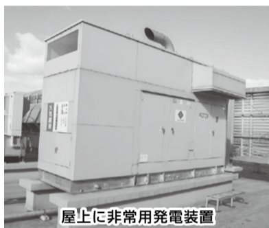
屋上に非常用発電装置

限の医療・設備機能を維持できる電力の確保が必要です。災害時、停電となった場合、自動的に自家発電装置が作動し、非常用コンセントに電力が供給されます。非常用コンセントには、人工呼吸器、酸素吸入器など重要な医療機器が接続され、最低限の医療機能は維持されます。通常3日分の燃料の備蓄があり、燃料の補給が可能であれば、自家発電装置は連続運転が可能です。