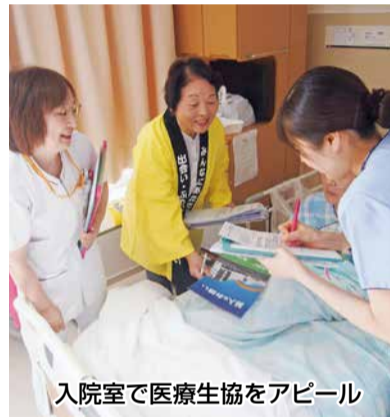
入院室で医療生協をアピール

健生病院・健生クリニックが移転して2年が経ちました。多くの組合員の皆様のご支援によって成り立っていることを日々実感しております。