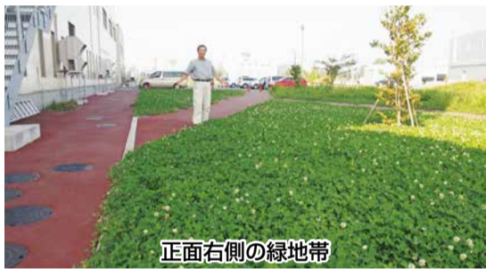
正面右側の緑地帯

生協の病院Ⅱおらだじの病院だ。病院正面右(東)側の一角は、クローバーのじゅうたんなんです。春、雑草が目立ってきたことに気がついた。このままでは雑草園です。雑草は何よりたくましい。特にヨモギは根こそぎ抜くしかないのです。「よし、この一角だけでも緑を守ろう!」今年の春から、私の草取りボランティアは始まりました。今は写真のよう