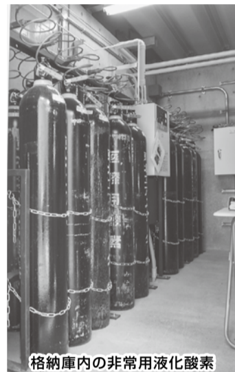
格納庫内の非常用液化酸素