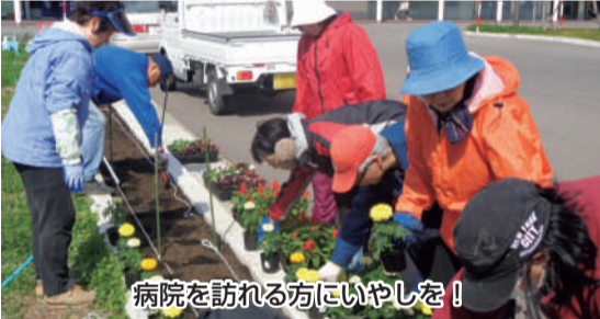
病院を訪れる方にやさしを!