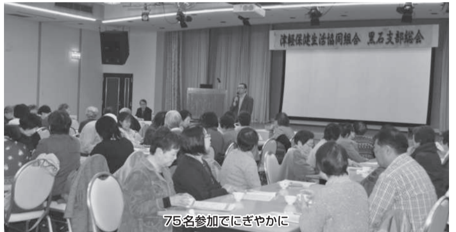
75名参加でにぎやかに

健生黒石診療所は職員一同、医療生協の事業所として、地域支部との協力の力で地域づくりを進めていきます。