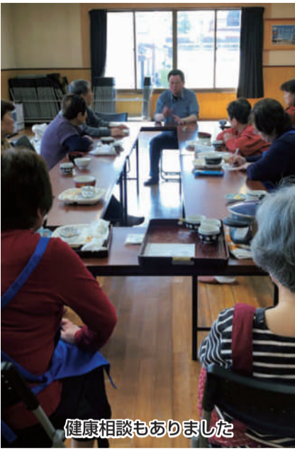
健康相談もありました

康相談会を実施しました。ストレッチは、セラバンドが予想以上に硬く難しい。それでもみんなで笑いながら楽しく挑戦しました。極めることができるように「また来月もやろう!」と盛り上がり