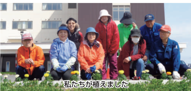
私たちが植えました

去年とは、少し違った色合いになりました。基本、1週間に1回位の水やりや花壇の清掃をしないとと考えています。曜日が決まりましたら、「健康」にお知らせしますから、五中支部以外