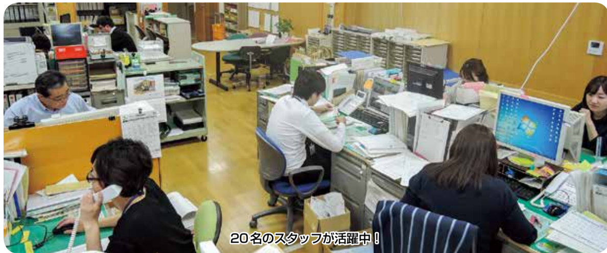
20名のスタッフが活躍中!