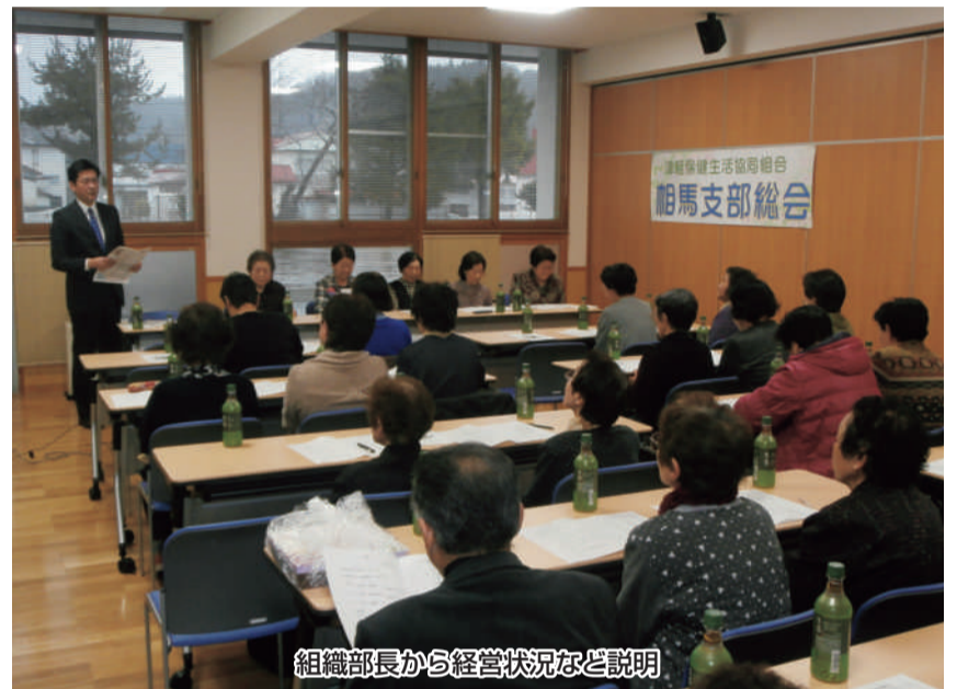
組織部長から経営状況など説明