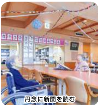
丹念に新聞を読む

置などを行います。2018年9月から天然保湿成分を配合したボディソープを利用したミスト浴を導入し、車椅子のまま入ることが出来て好評です。また、入居者の皆様に楽しんでいただくために毎週水曜日にレクリエーションも開催しております。四季の飾りつけや年間行事も企画して