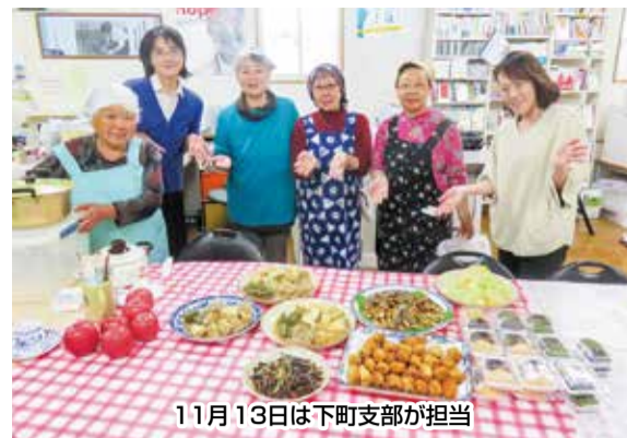
11月13日は下町支部が担当

「母ちゃん食堂」は組合員さんたちのご協力があってこそその取り組みです。お料理を作っていたのは勿論、お米、野菜の提供も大変助かっています。本当にありがとうございます。