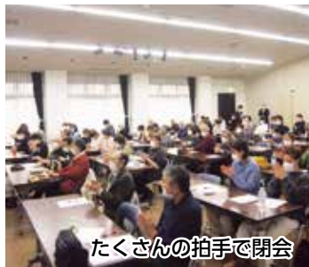
たくさんの拍手で閉会

黒石支部の組合員数は昨年10月末時点で約3160名。組合員世帯数は2780世帯あり、手配り部数は約1630部、手配り率58%、新聞手配