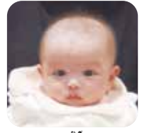
中村 凧ちゃん かわいすぎて困っちゃう♡みんなのアイドル♡大きくなってね!