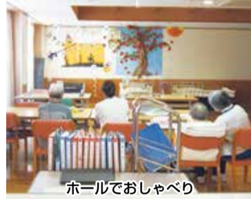
ホールでおしゃべり

【ナーシングホームたまち】は、『看多機』と呼ばれる事業所で、2020年4月に開設されました。通い・泊り・訪問看護・訪問介護を組み合わせたサービスを利用できます。介護が必要な方だけでなく、点滴や在宅酸素、カテーテル管理の医療処置が必要な状態になっても、住み慣れた自宅での生活が安心して続けられるように、看護・介護が協働して支援します。 先日、97歳でお亡くなりになった利用者様の娘様から頂いたお手紙には「(前略)母をひとりのかけがえのない人間として、最後まで大切にしていたことが、私を救ってくれました。皆様存在が、私の大きな支